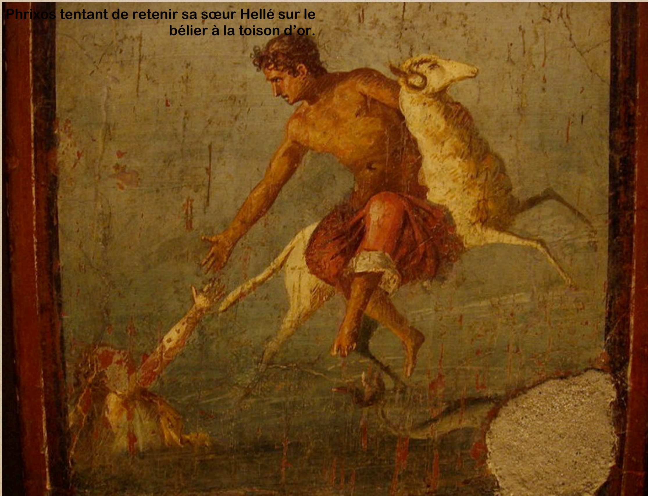
Phrixos tentant de retenir sa sœur Hellé sur le bélier à la toison d'or.