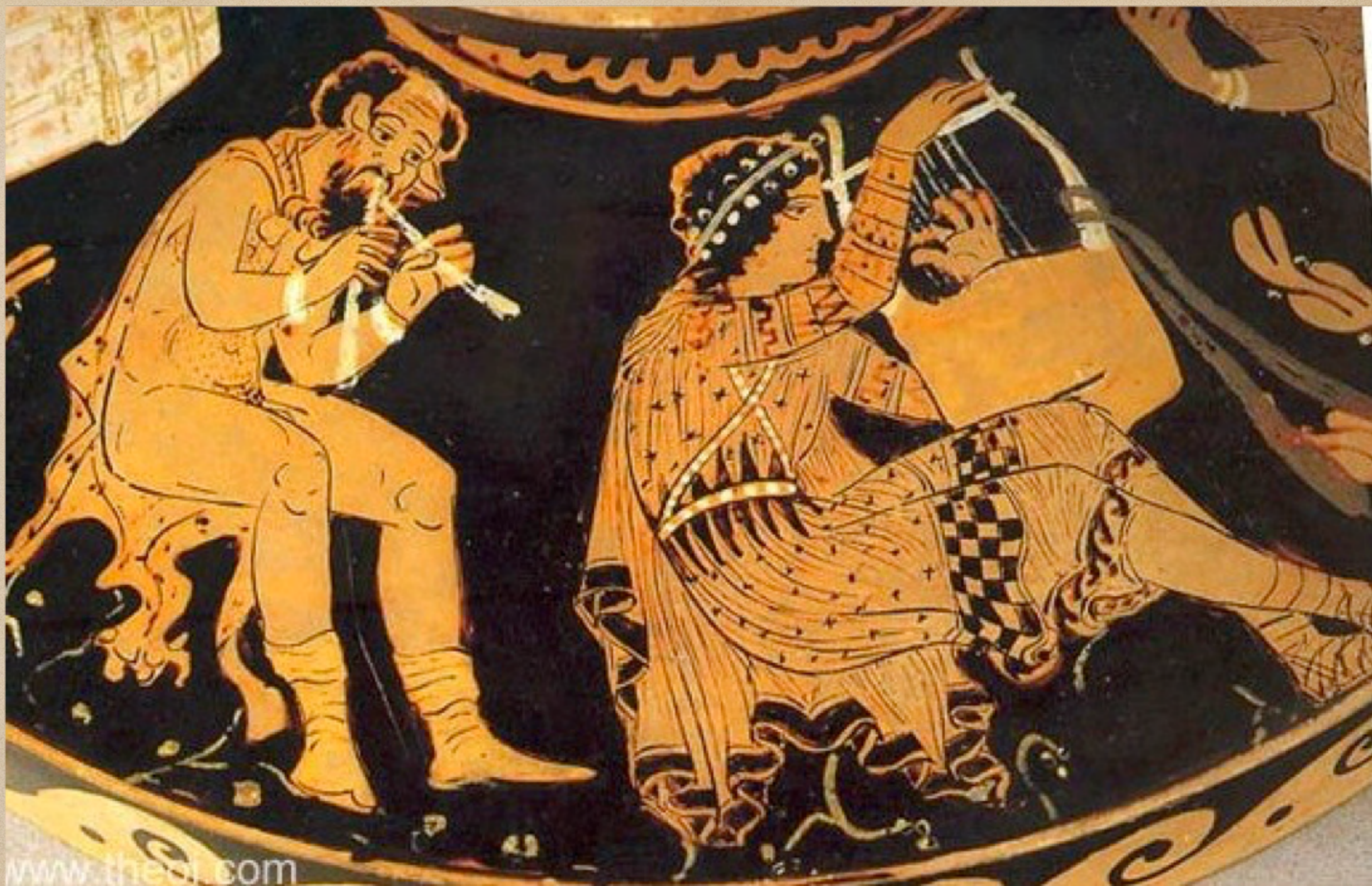
Marsyas et Apollon: concours musical, Louvre