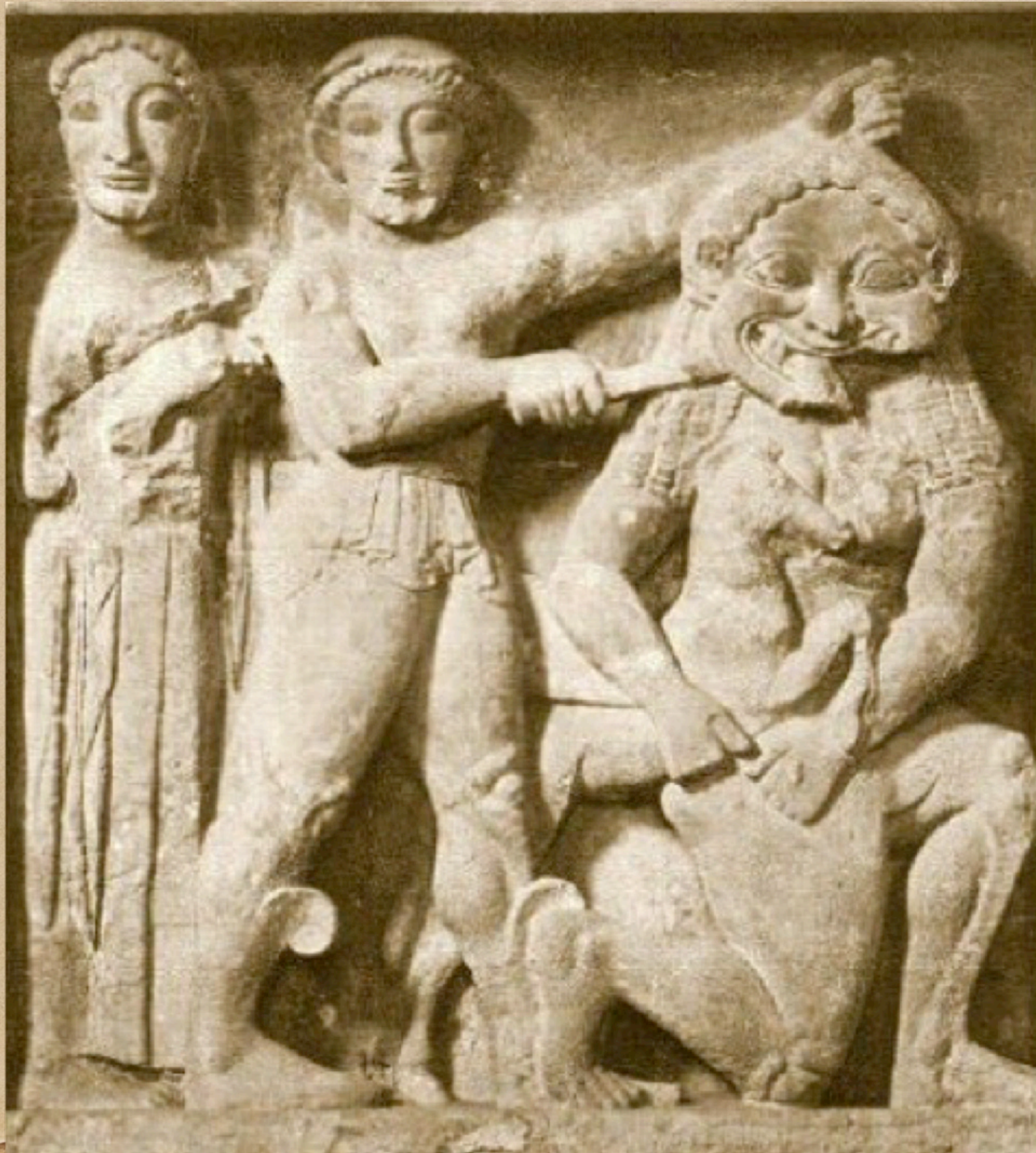
Persée coupant la tête à la Gorgone Méduse