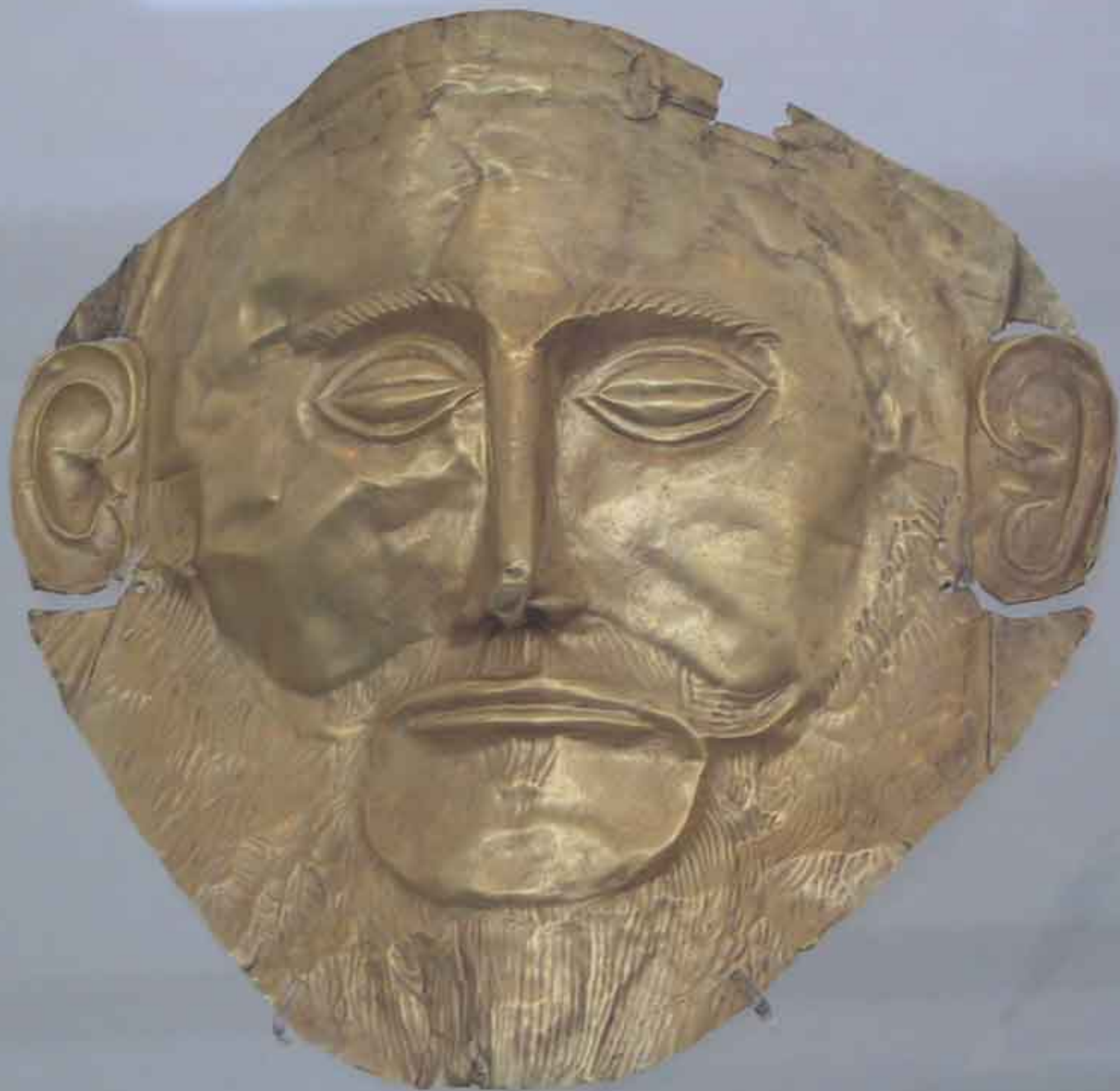
Agamemnon. Masque mortuaire en or trouvé par Schliemann. Musée archéologique d'Athènes.