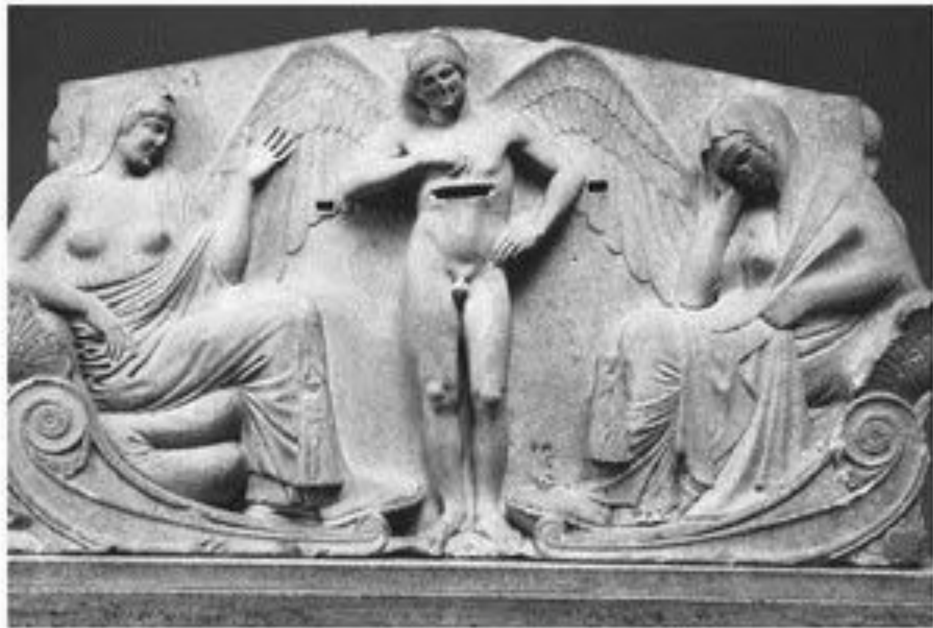
Thanatos entre Aphrodite et Perséphone